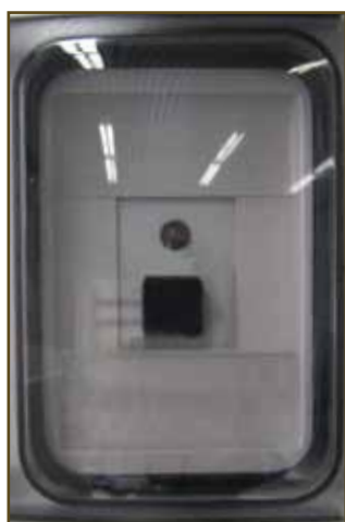
Hlavní ovládací modul